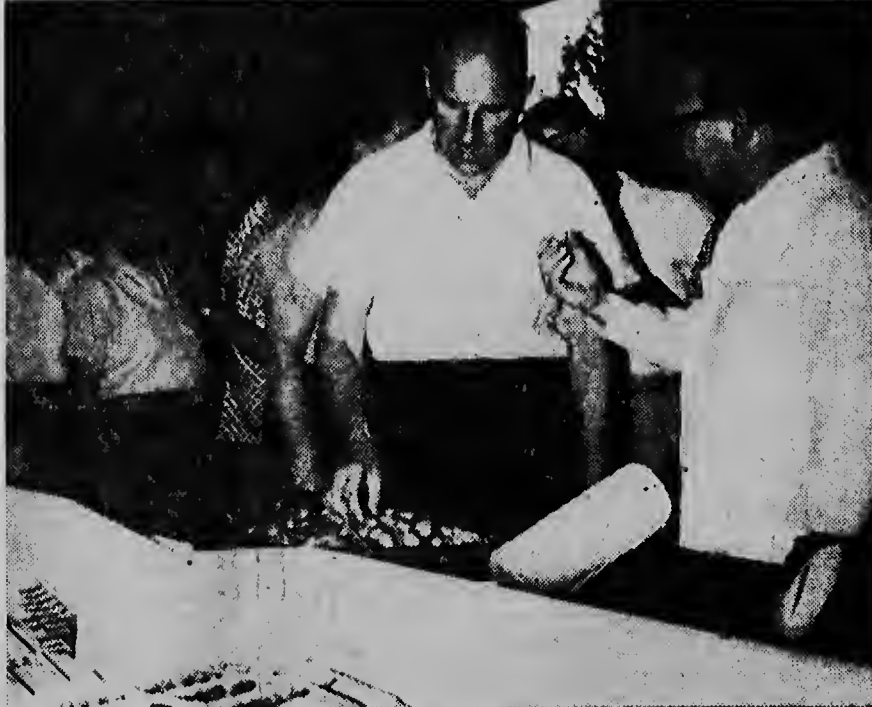
Premier Jonckheer ta mostra minister Luns un „Komkomber di Aruba“ di e nutriculture farm.

Ta ser spera cu denter di poco un segundo grupo di interesadonan lo bai sigi e curso di Dale Carnegie na Aruba.